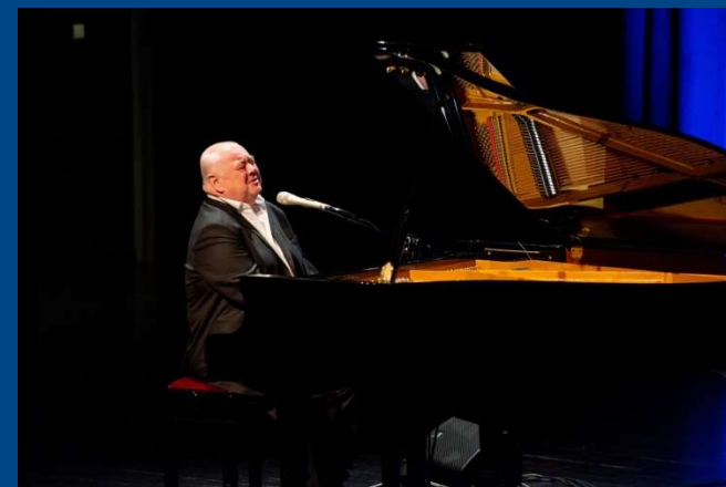
Koncert Stanisława Sojki