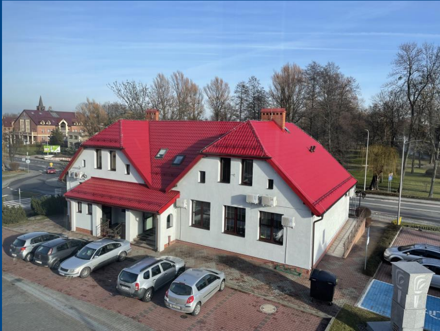
Remont dachu budynku Biblioteki Publicznej i Gminnego Zespołu Oświaty. Koszt: 413 000 zł