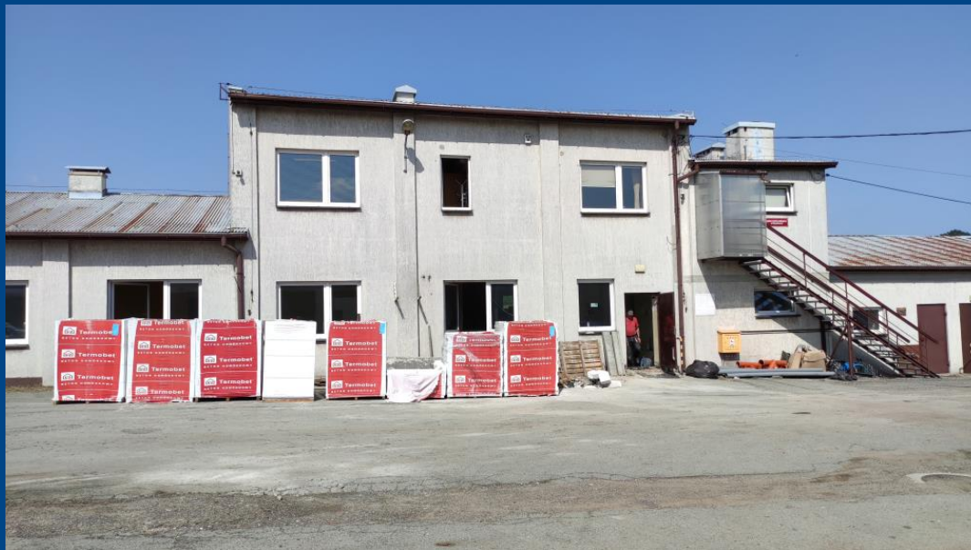
Rozbudowa budynku GZK w Pawłowicach wraz z zagospodarowaniem terenu. Planowane zakończenie inwestycji: kwiecień 2024 r. Koszt: 3 280 000 zł