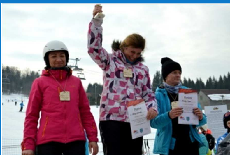
Mistrzostwa w Narciarstwie Alpejskim