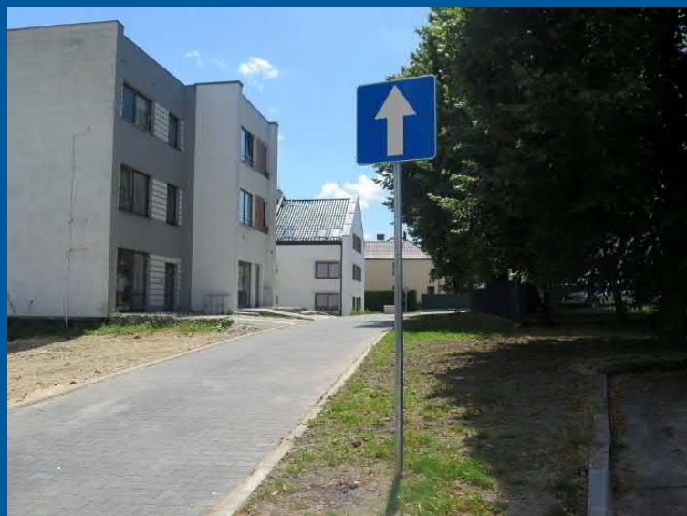
ul. Mały Rynek w Pawłowicach