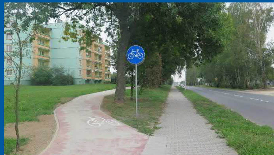
Ciąg pieszo-rowerowy przy ul. Wodzisławskiej (Pawłowice i Osiedle Pawłowice - dofinansowanie dla powiatu)