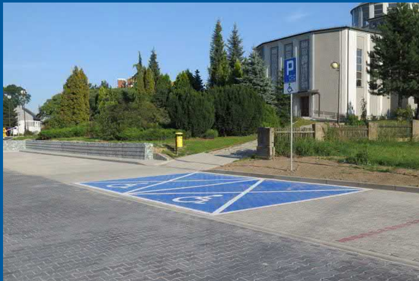
Parking w centrum Warszowic