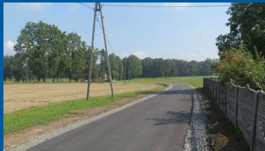
ul. Stawowa w Warszowicach