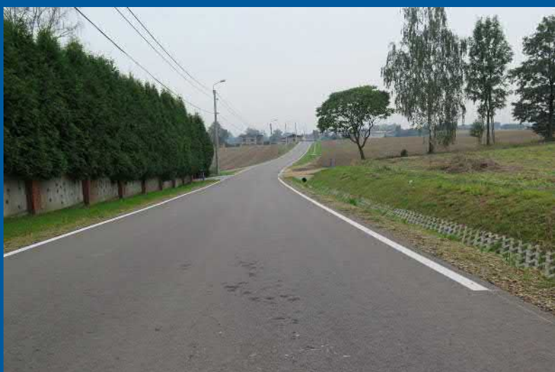
ul. Partyzantów w Krzyżowicach (współpraca z Jastrzębiem-Zdrój)