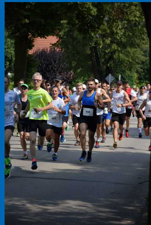
Bieg Pawłowicki – od 2015 r.