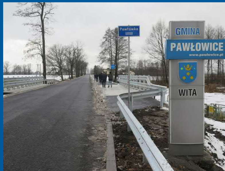
ul. Pszczyńska w Warszowicach (dofinansowanie dla powiatu)