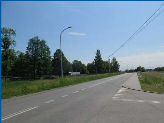
Oświetlenie ul. Zjednoczenia w Pawłowicach