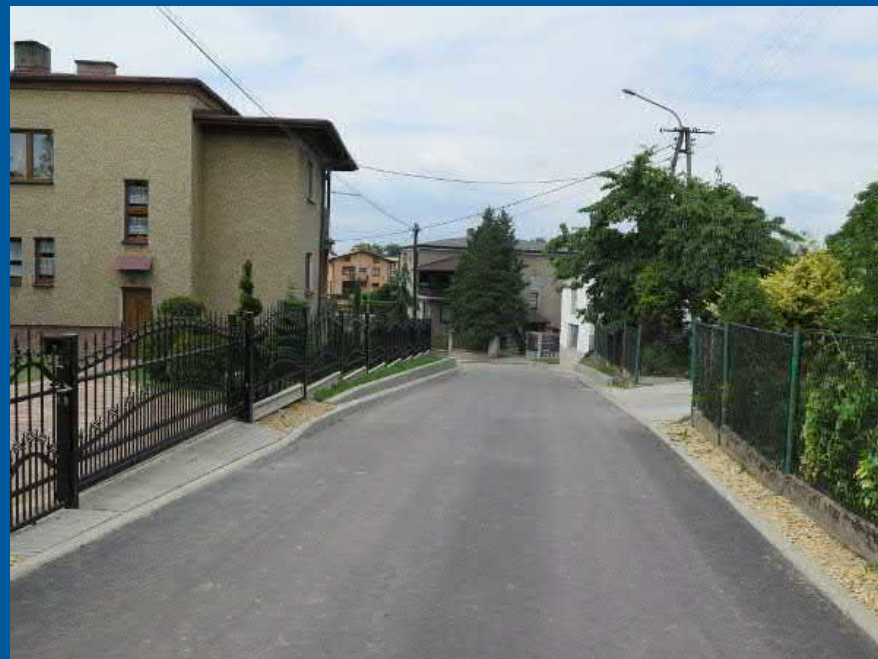
ul. Grzybowa w Pawłowicach