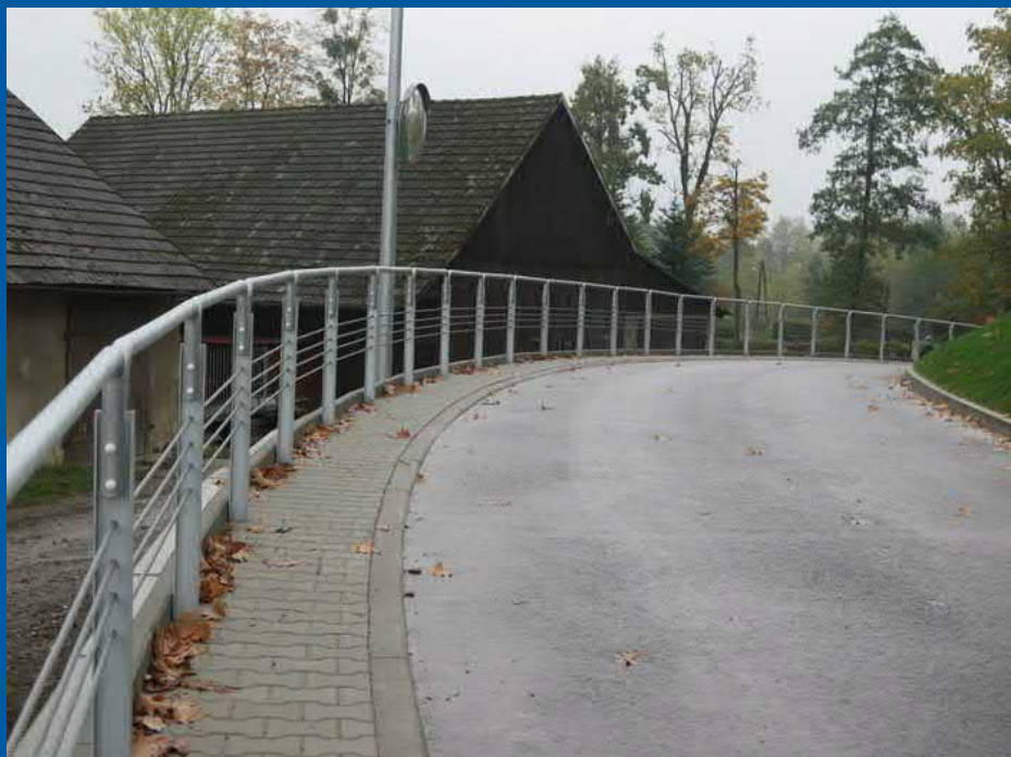
ul. Miarki w Pielgrzymowicach