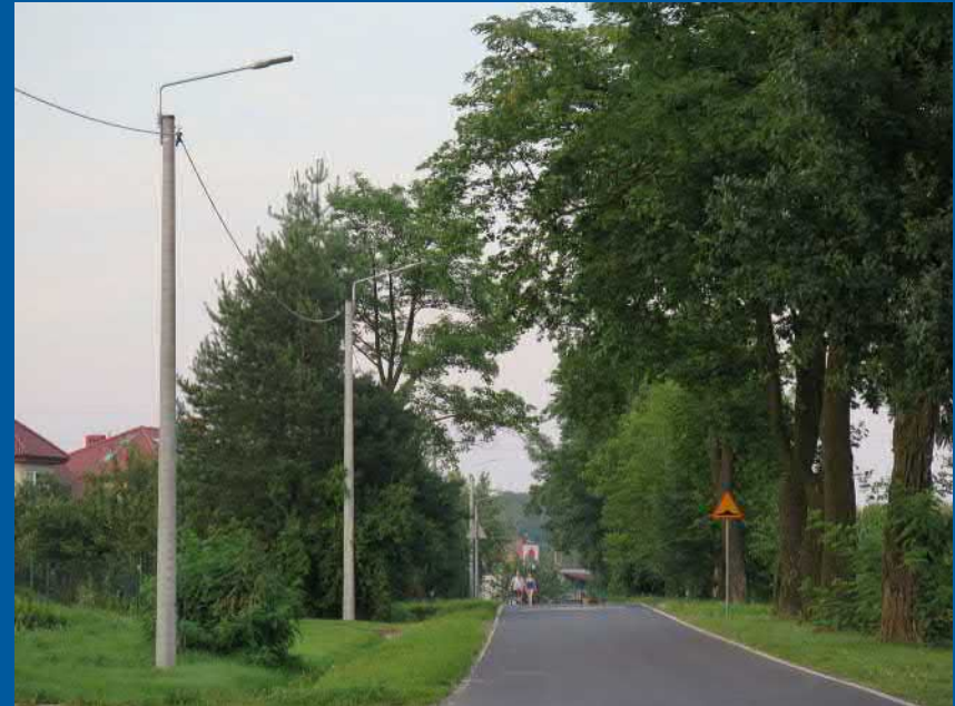
Oświetlenie ul. Klonowej w Pawłowicach