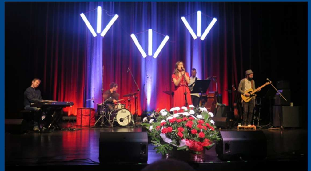
Obchody Święta Niepodległości 11 listopada