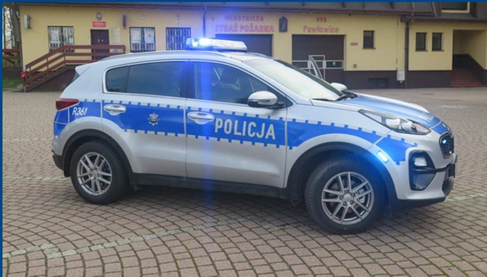
Zakup auta służbowego dla Komisariatu Policji w Pawłowicach