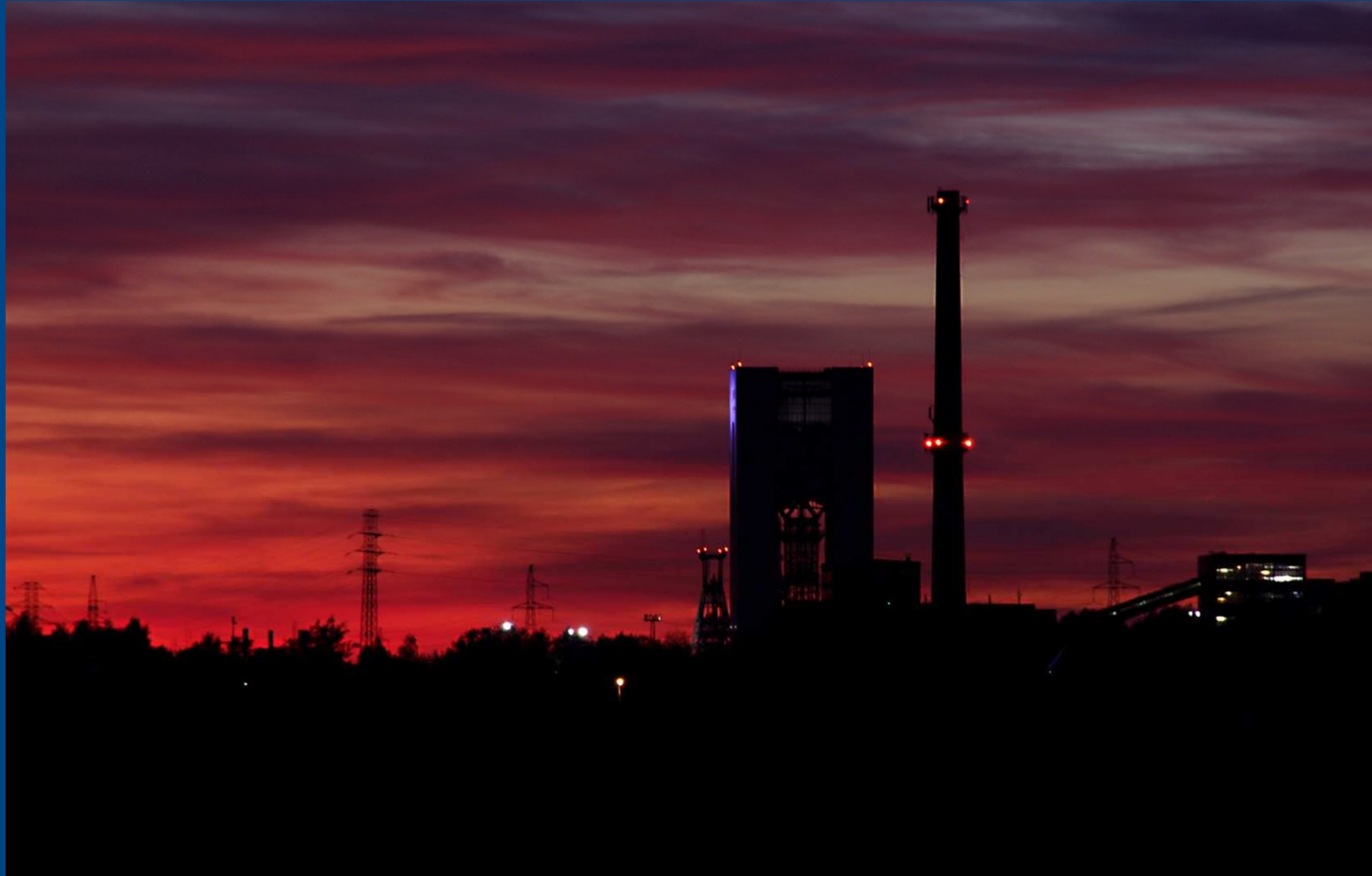
Zdjęcie nadesłane do konkursu „Migawka z gminy Pawłowice 2019”