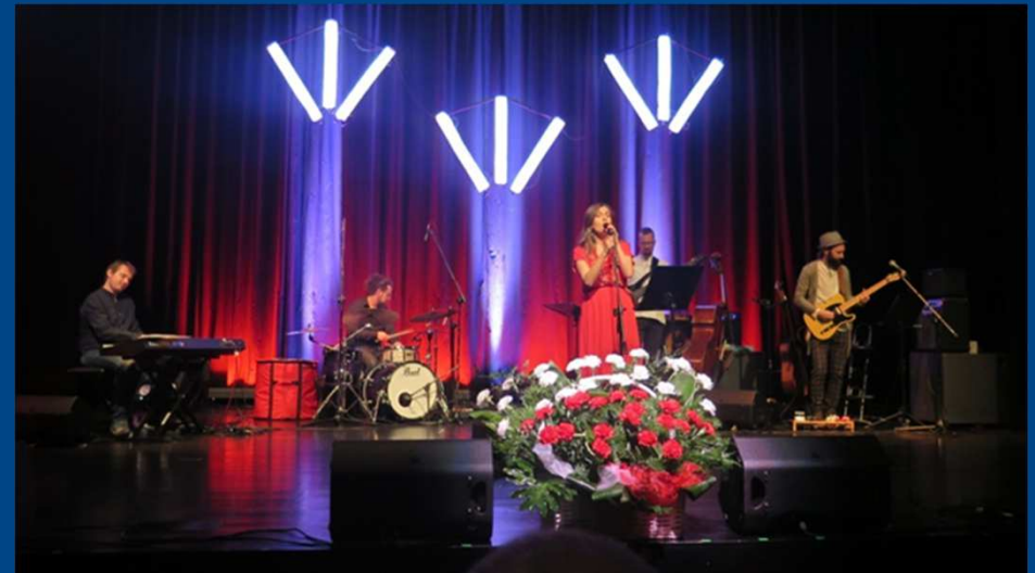
Obchody Święta Niepodległości 11 listopada